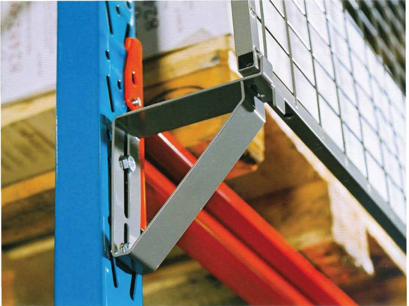
Der Sturzschutz verhindert, dass Waren vom Palettenregal nach hinten herunterfallen. Die Sturzschutzelemente werden mit Konsolen am Regal befestigt. Die Konsolen haben zwei Befestigungspunkte und können nur ausgehakt werden, wenn die Bolzen am Gitterelement gelöst werden.